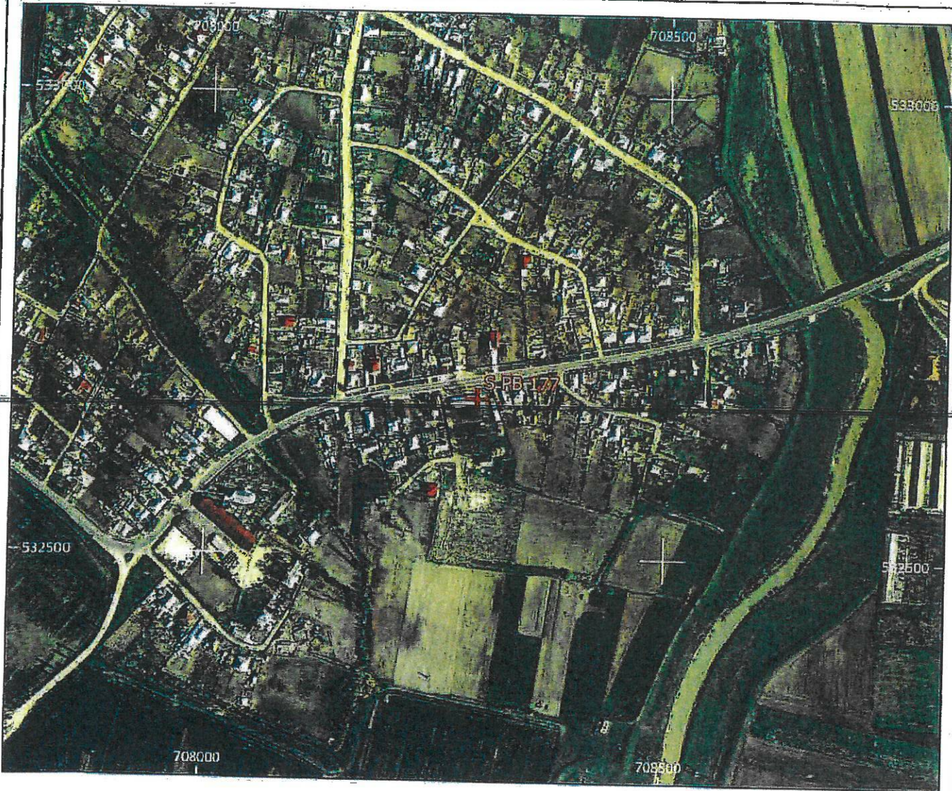
Amplasament sirenă - Faza HCL